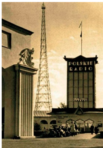
Pawilon centralny Targów Wschodnich, 1938 r.