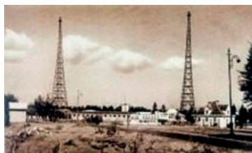
Nowa radiostacja Polskiego Radia we Lwowie