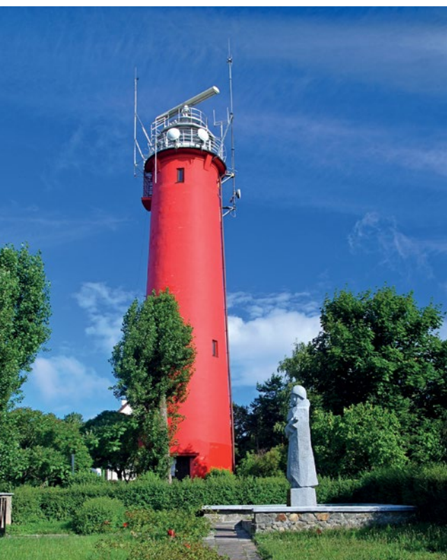
Latarnia morska w Krynicy Morskiej

Staramy się podtrzymywać tradycje krótkofalarstwa, które rozpoczęły się w naszym kraju w 1924