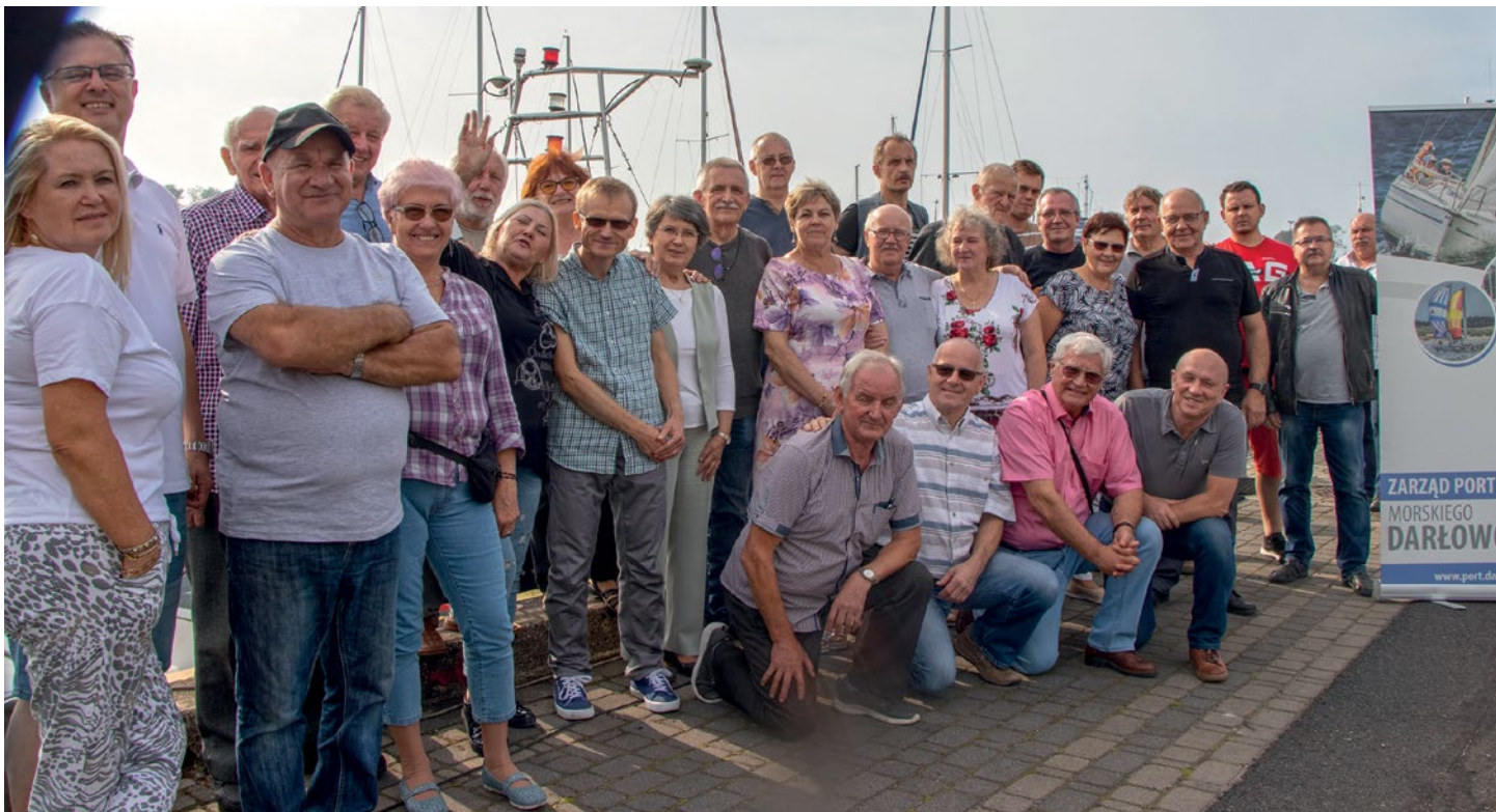
Zdjęcie zbiorowe uczestników spotkania w Darłowie