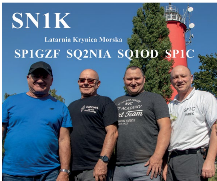
Operatorzy stacji SN1K